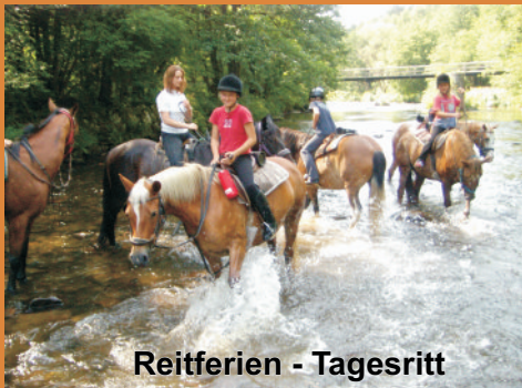
Reitferien - Tagesritt

Der Kapellenhof liegt in völliger Ruhe ca. 2,5 km von Perlesreut und Ringelai entfernt. Die Lage im romantischen Ohetal macht ihn vor allem für Reiter, Natur - und Wanderfreunde besonders interessant. Familien mit Kindern sind bei uns herzlich willkommen.